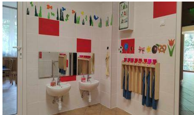
Iskola bölcsőde – fürösztő felújítás (2023)