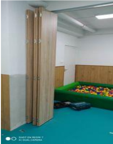
Iskola bölcsőde – új tornaszoba