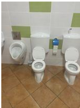
Iskola bölcsőde – fürösztő felújítás (2)