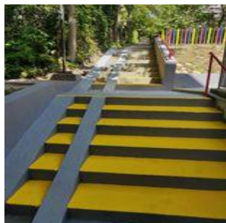
Tigris bölcsőde – felújított külső lépcsősor