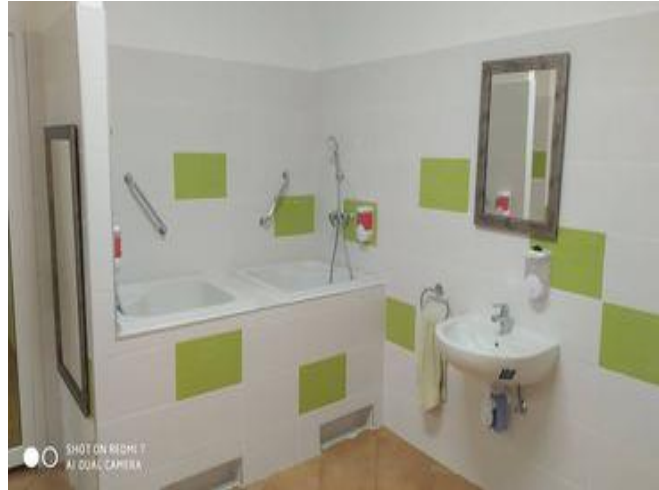
Iskola bölcsőde – fürösztő felújítás